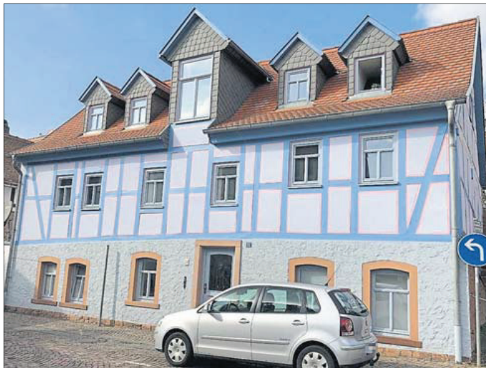
In der Burgstraße von Gelnhausen findet sich dieses Fachwerkgebäude.