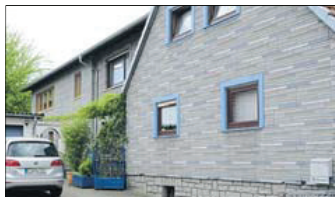
Das Haus in Niederzell vor der Renovierung.