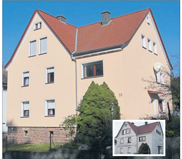
Im Sinntaler Ortsteil Sterbfritz ist dieses Wohnhaus zu finden.

Die kleinen Bilder zeigen jeweils den Zustand vor der Sanierung.