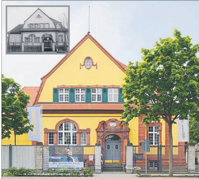
In der Hanauer Lamboystraße steht dieses imposante Gebäude.

Die kleinen Bilder zeigen jeweils den Zustand vor der Sanierung.