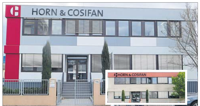
Dieses Firmengebäude wurde in Frankfurt renoviert.

Der Große Fassadenpreis ist ein Ehrenpreis. Der Sieger erhält einen Wanderpokal und ein Schild für sein Betriebsgelände. Die Siegerehrung ist für Mittwoch, 9. Mai, geplant und findet erstmals auf der Messe Wächtersbach statt. Auf dem Messegelände an der Kinzig wird im Stil der „Oscar“-Verleihung unter den Augen aller Beteiligten ein versiegelter Umschlag geöffnet und der Sieger verkündet. hgs