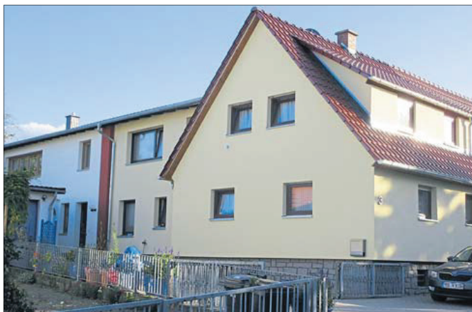
Dieses Wohnhaus-Ensemble steht in Schlüchterns Stadtteil Niederzell.